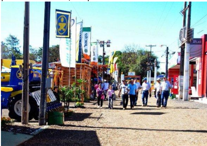
Masiva concurrencia recibe la Expo Santa Rita 2013.

Rueda de negocios en la Expo Santa Rita, mañana -- Un encuentro internacional de negocios y un seminario destinado al sector se desarrollarán mañana jueves, en el marco de la Expoferia Santa Rita 2013. El evento se desarrollará en el salón “Centro de Tradiciones Gaúchas”, a partir de las 08:00, en que arrancarán las acreditaciones.